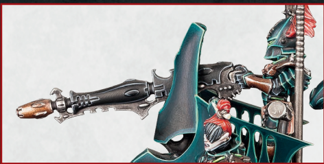
デイスインテグレイター・ キャノン